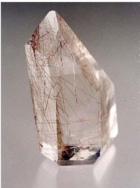
Rutilo kvarcas (Brazilija)

Dar vadinamas Veneros plaukais, Amūro strėlėmis, Angelo plaukais ir t.t.