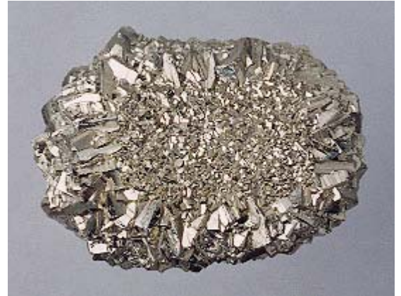
Pirito rožė (Kinija)

PRAZEMAS padeda išspręsti konfliktus ir kontroliuoti savo gyvenimą, susivaldyti, tvarkyti "užsidegimus" ir taip išvengti pykčio priepuolių. Ypač tinka konfliktiškoms asmenybėms.